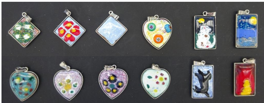
(上: 七宝の技法で作ったアクセサリ)