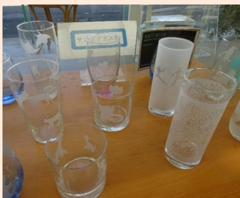
(上: サンドブラストで模様を付けたグラス)

神奈川工科大学の自慢の施設であるKAIT工房※で、サンドブラストや七宝焼き(釉の焼き付け)の技法を学び、世界で一つだけのガラスやアクセサリを制作しませんか?