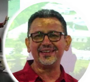
ルーベン先生(2025年度) 今年度はヘンリー先生