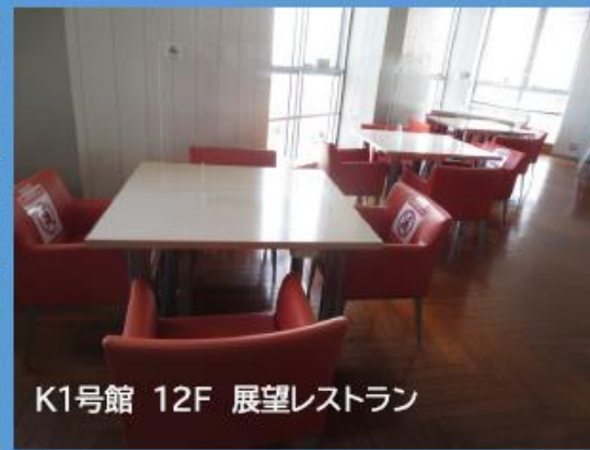
K1号館 12F 展望レストラン