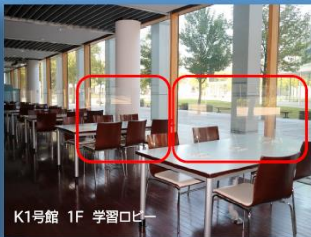
K1号館 1F 学習ロビー