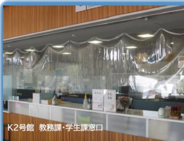
K2号館 教務課・学生課窓口

学習ロビー等のテーブルには、飛沫対策のためKAIT工房オリジナルの亚克力板を設置しています。