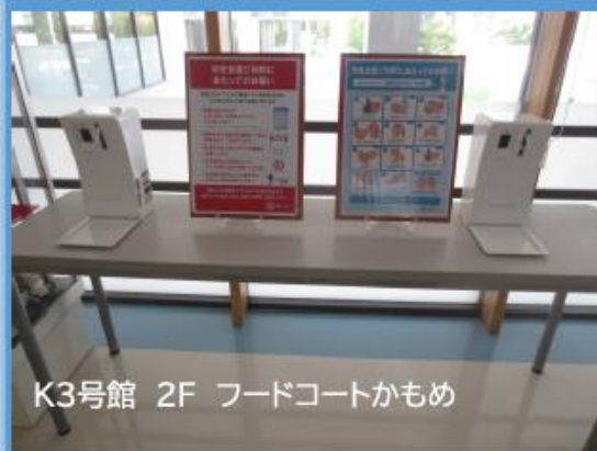
K3号館 2F フードコートかもめ

手指消毒用アルコール設置、座席の間引き、亚克力板を設置。会話は控えるなど皆さん自身の感染防止行動が何より大切です。