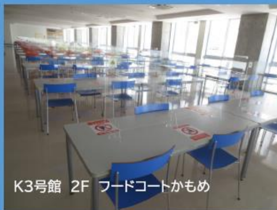
K3号館 2F フードコートかもめ