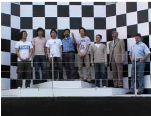
シルバーストーンサーキット訪問