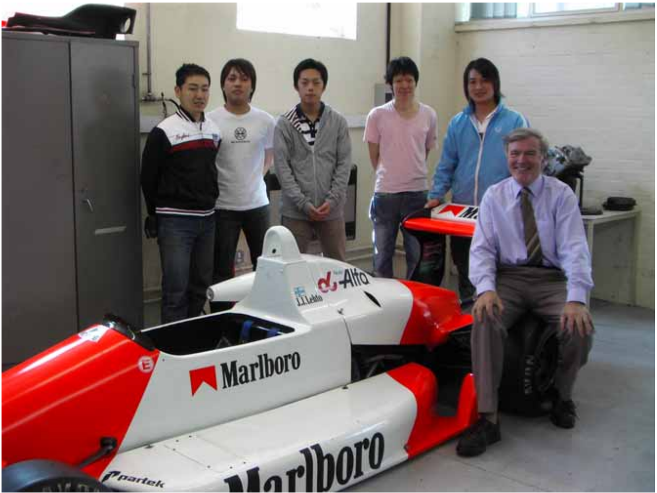
2006年度海外自動車工学研修参加者