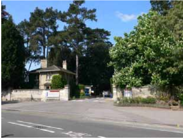
オックスフォード・ブルックス大学