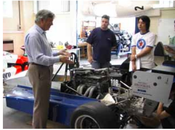
海外自動車工学研修