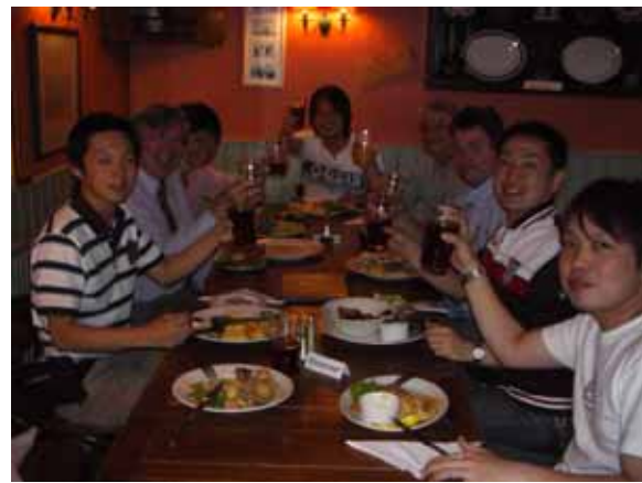
オックスフォード・ブルックス大学のスタッフと