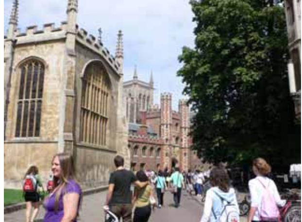
オックスフォード市内