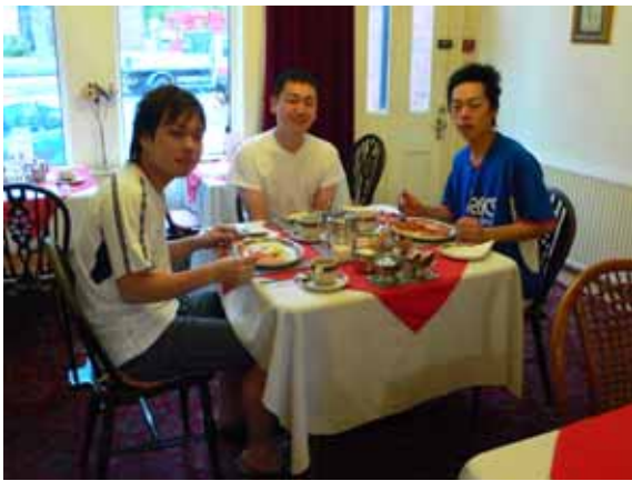
ランチタイムのひとつ