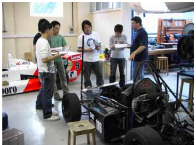
海外自動車工学研修